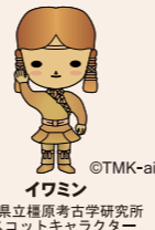
イワミン 奈良県立橿原考古学研究所 マスコットキャラクター

また、北池の水位は、南北方向石組み溝の機能を踏まえると、北池満水時で 107.4mを若干超える高さであったと想定できます。南池の水位は、約 107.8mであることが判明しているため、南池と北池の水位は同じではなく、高低差が存在することがわかりました。