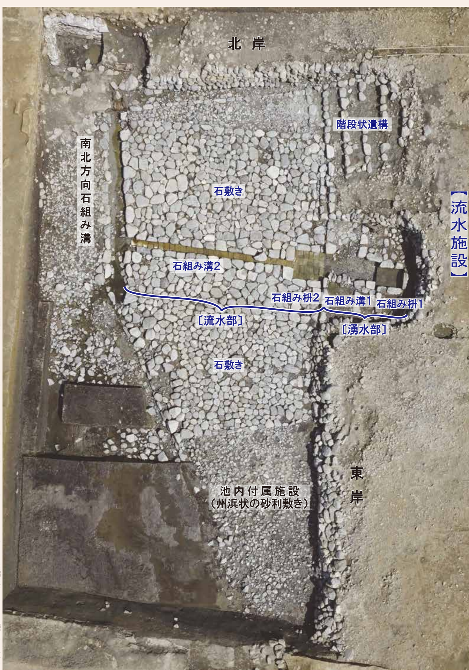
北池北東部垂直写真（上が北）