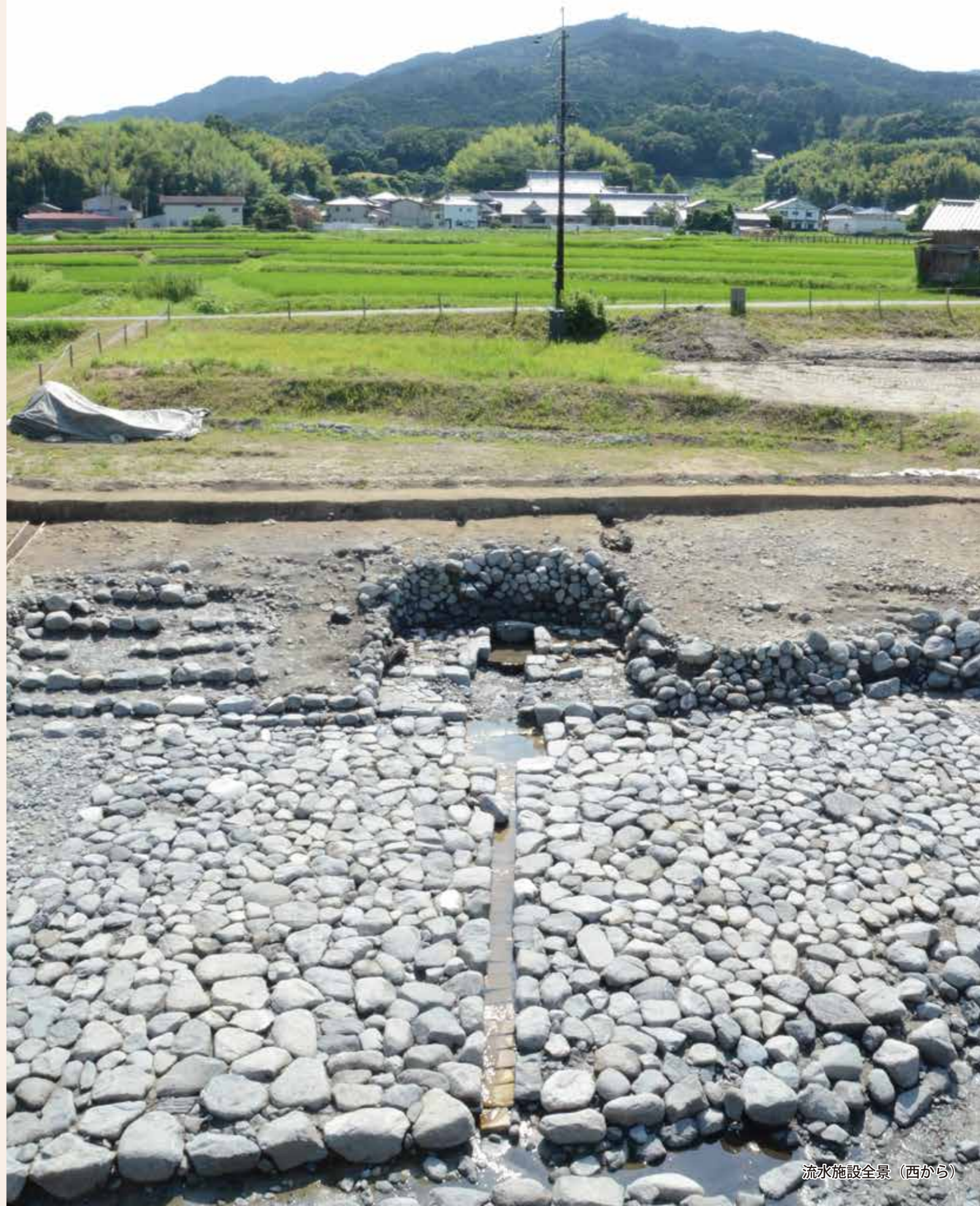
流水施設全景（西から）