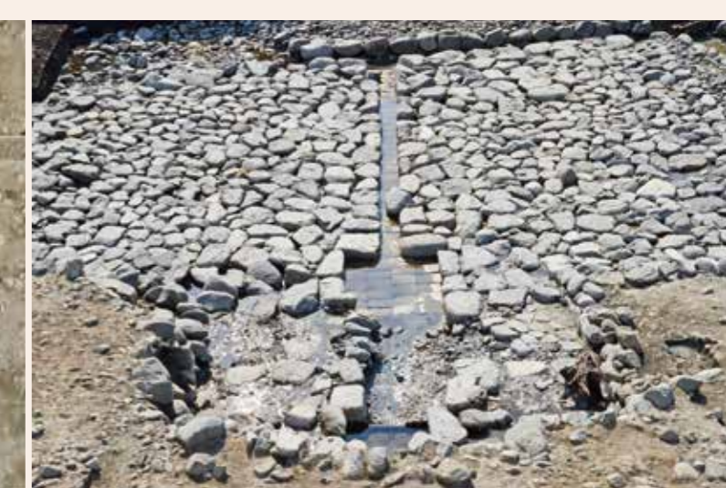
湧水部と流水部（東から）