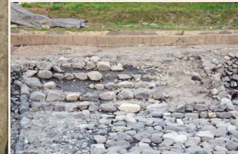
階段状遺構（西から）