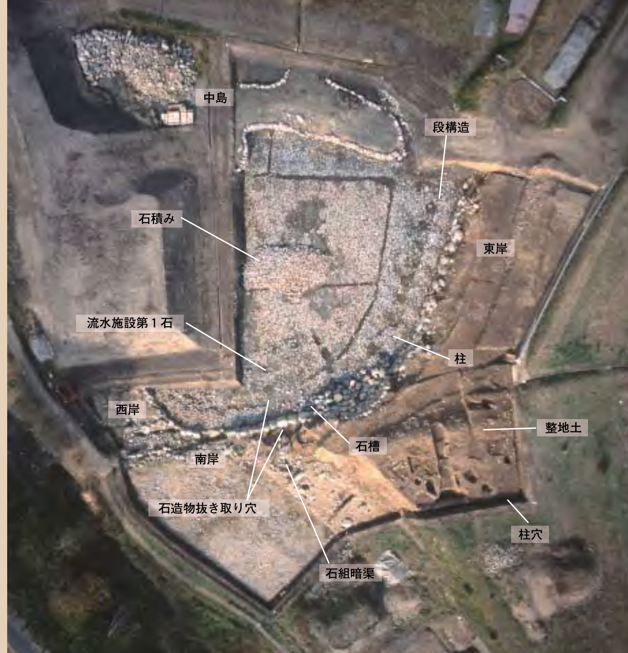
今回の調査区の航空写真 (上が北)