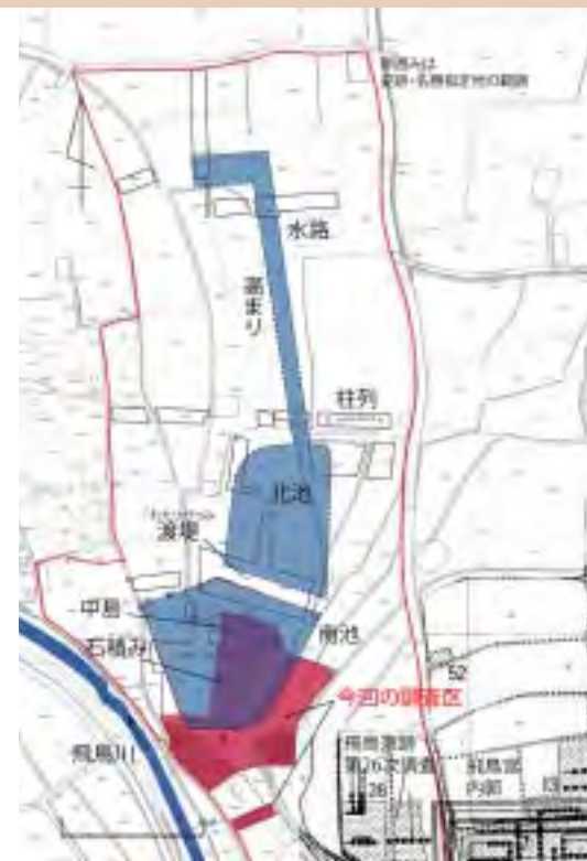
苑池と今回の調査区 (S=1/3,000)