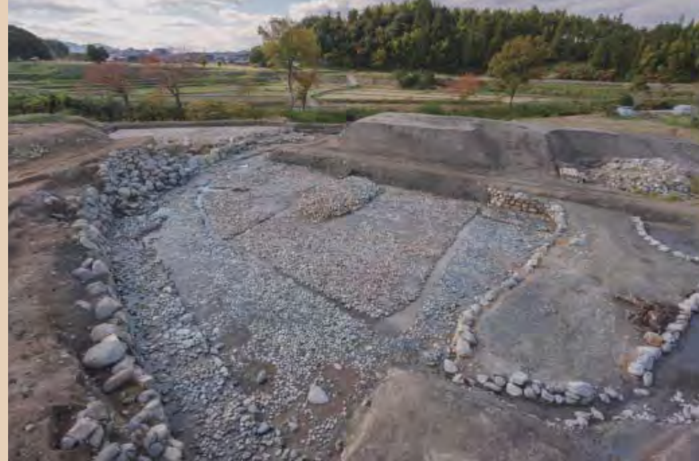
南池東半全景 (北東から)