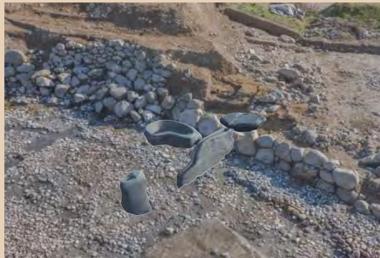
南池南岸と石造物の配列イメージ (北西から)