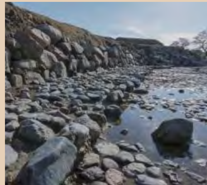
東岸と底石の段構造 (北から)