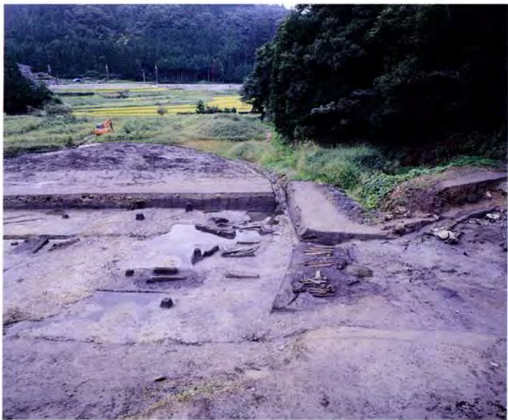
流路跡 1 (東から)