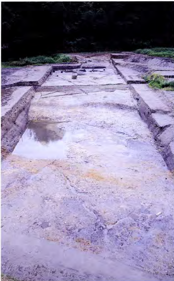
調査地全景(南から)