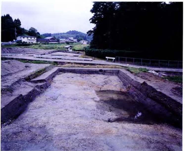
流路跡 2 (北から)