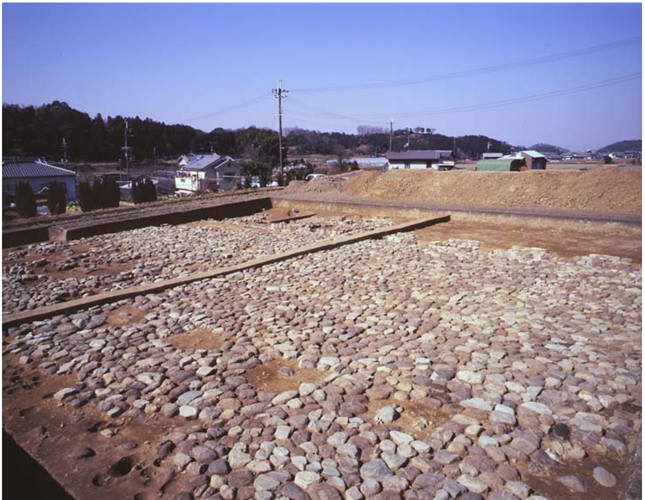
写真3 石敷広場(南東から)