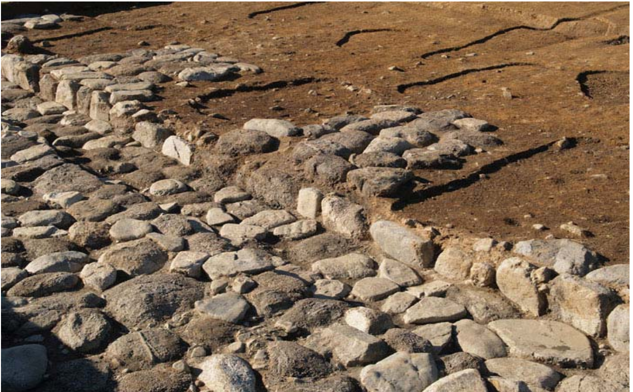
写真5 建物1南面東側の昇り段(南東から)