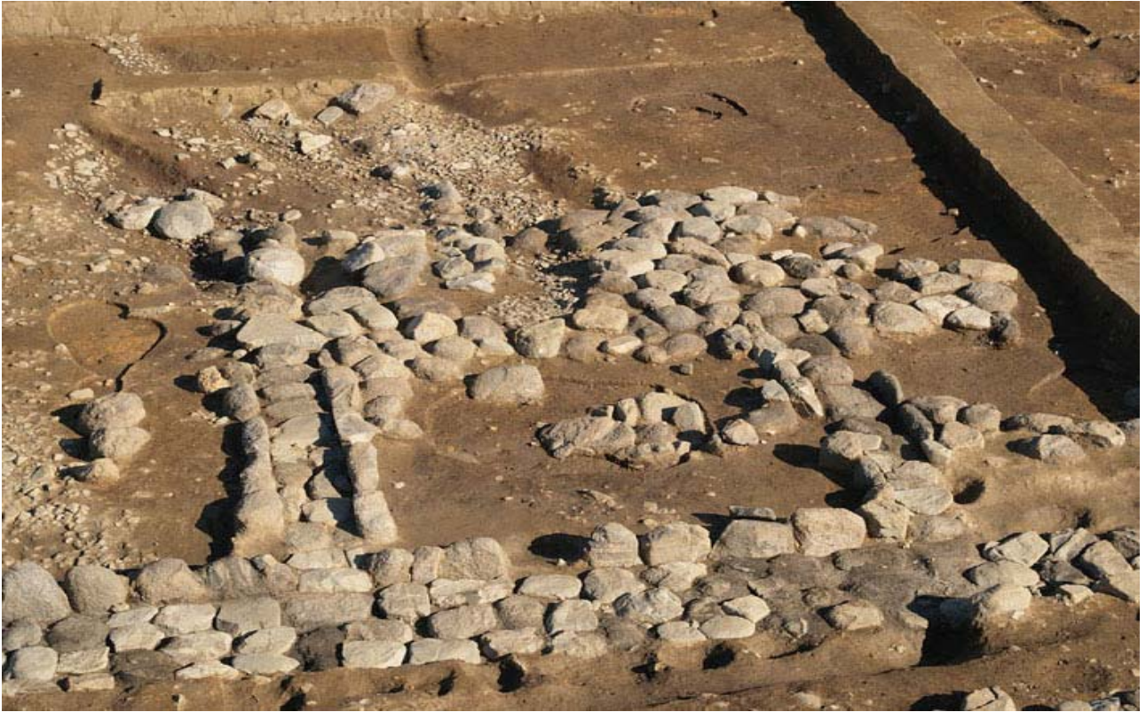
写真4 南北石組溝で区画された石敷(南西から)