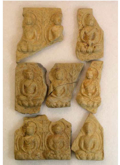
写真10 方形六尊連坐せん仏(二光寺廃寺独自)