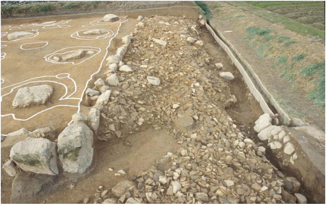
写真3 基壇北側の瓦層検出状況(東から)