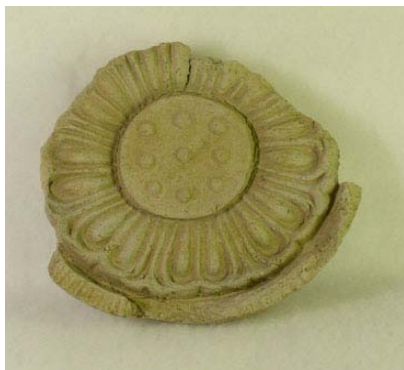
写真12 複弁蓮華紋軒丸瓦(檜隈寺同範)