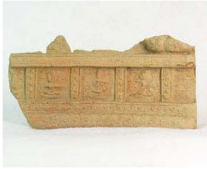
写真6 大型多尊せん仏(須弥壇片)