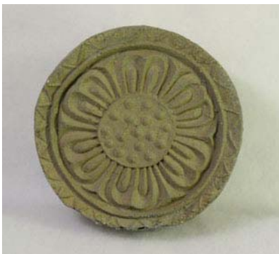
写真11 複弁蓮華紋軒丸瓦(朝妻廃寺同範)