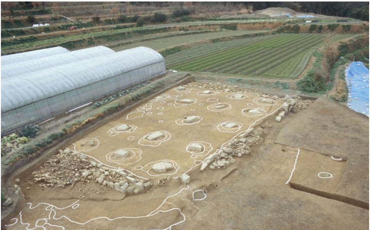
写真4 基壇と礎石建物3(南東から)