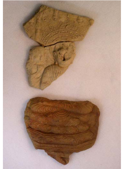
写真7 大型多尊せん仏(主尊)