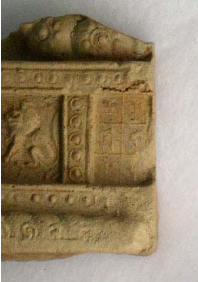
写真5 大型多尊せん仏(須弥壇紀年銘の細部)