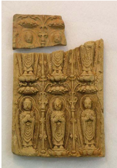
写真9 方形六尊連立せん仏(朝妻廃寺同範)