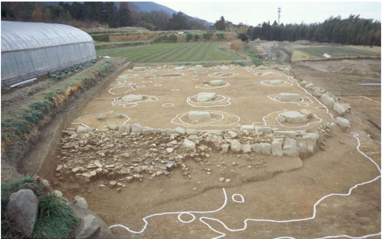
写真2 基壇と礎石建物2(南から)