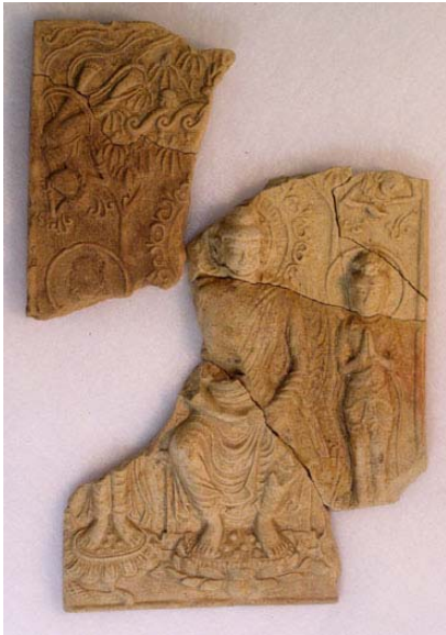
写真8 方形三尊せん仏