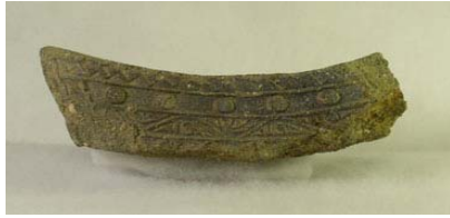
写真15 偏向唐草紋軒平瓦 (高宮廃寺同範)