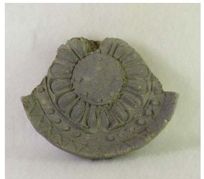
写真13 複弁蓮華紋軒丸瓦(高宮廃寺同範)