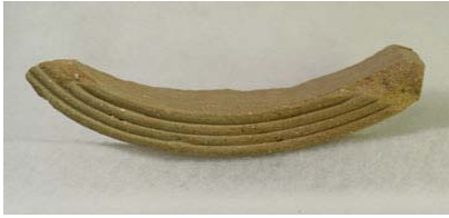
写真14 重弧紋軒平瓦