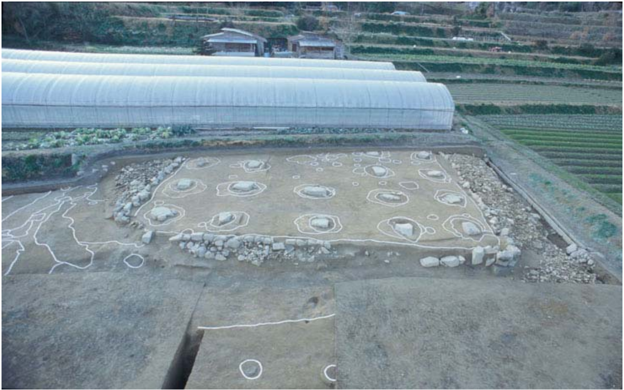
写真1 基壇と礎石建物1(東から)