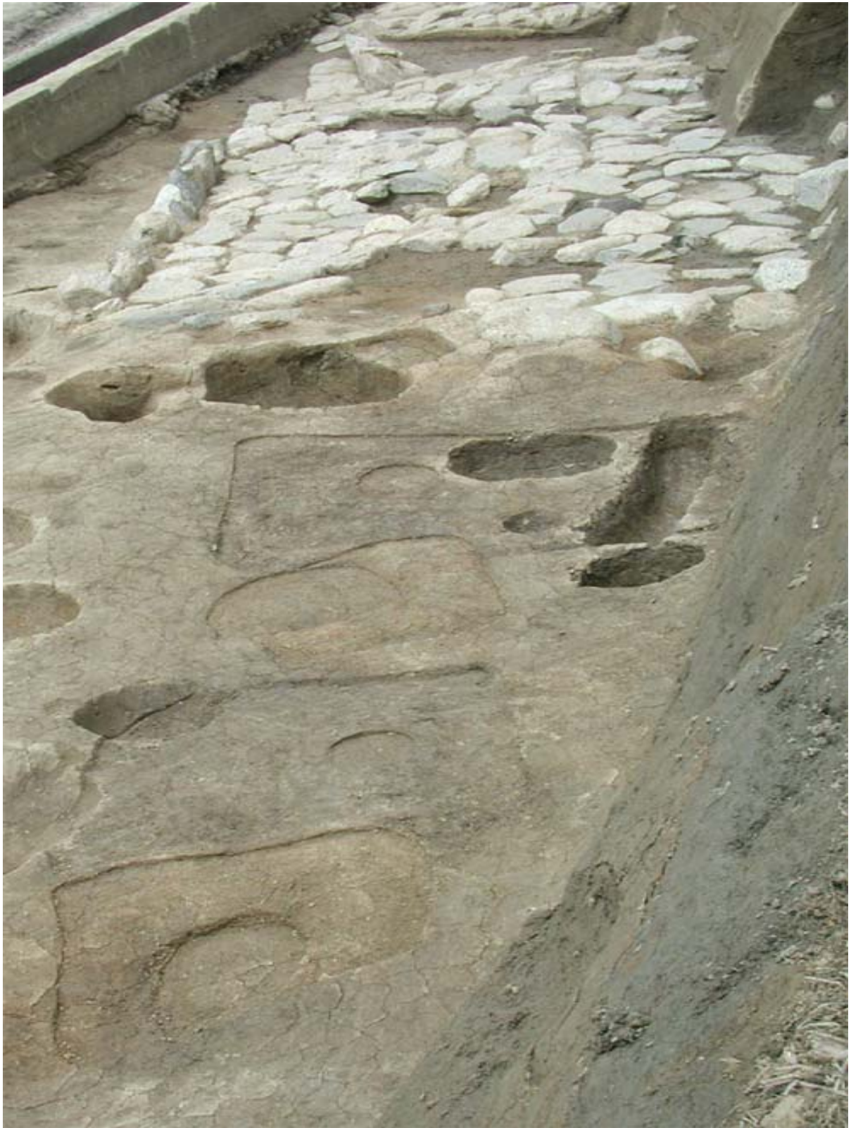
写真7 石敷遺構3と柱列(東から)