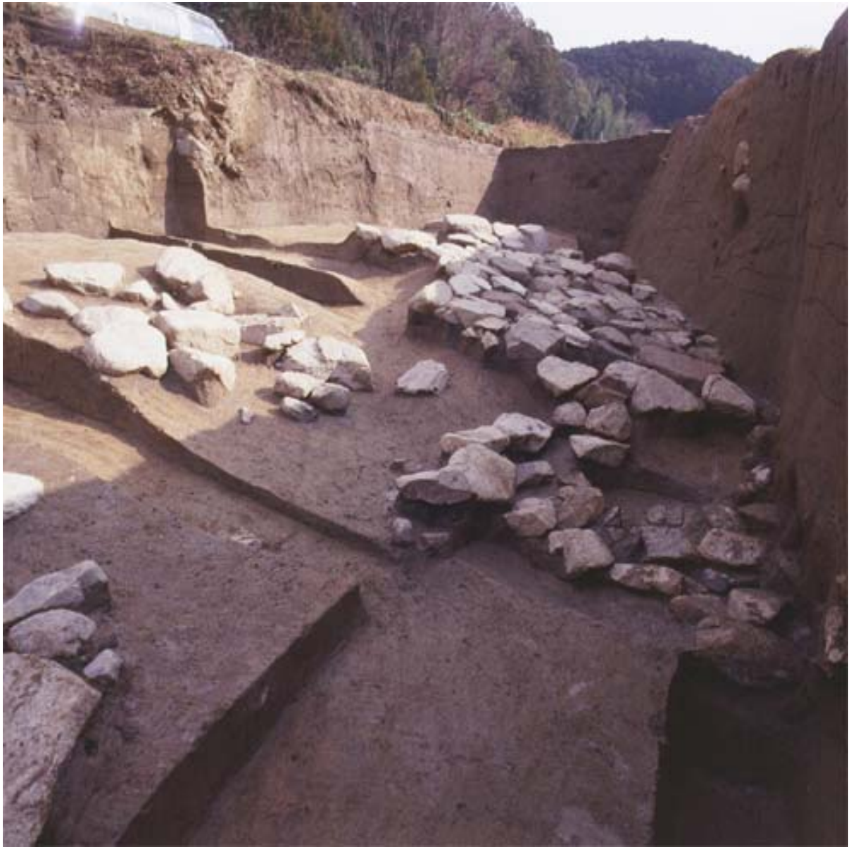
写真5 石敷遺構1(西から)