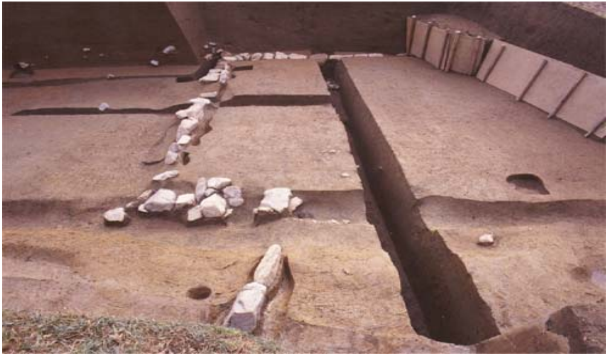
写真3 基壇状遺構(北から)