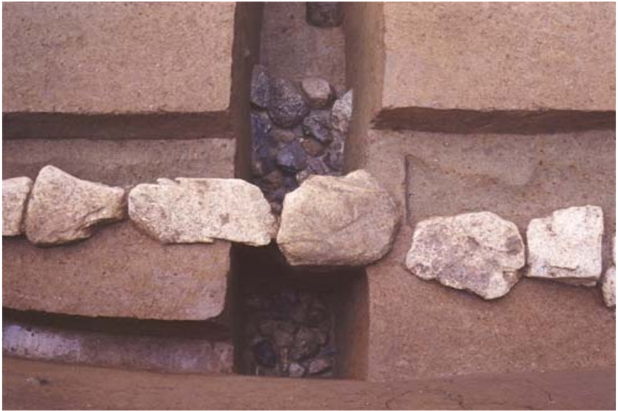
写真6 基壇状遺構と石敷遺構2(南から)