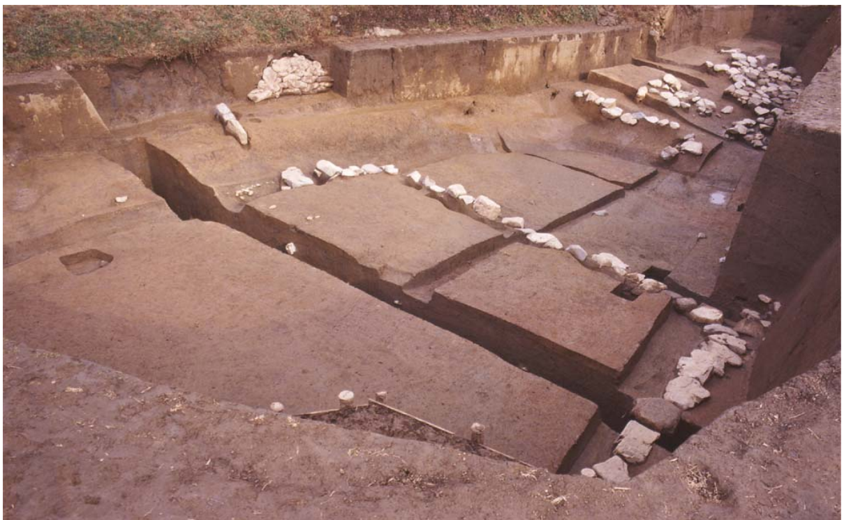
写真4 調査1区(西から)