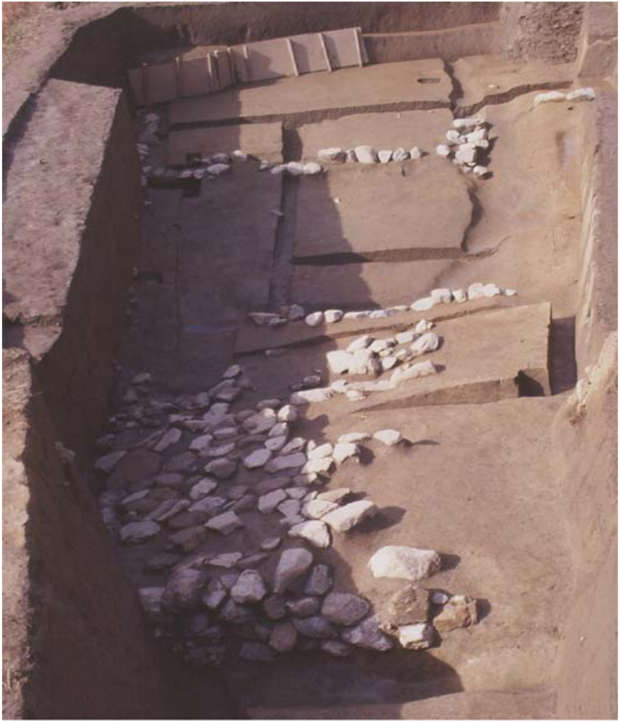
写真2 調査1区(東から)