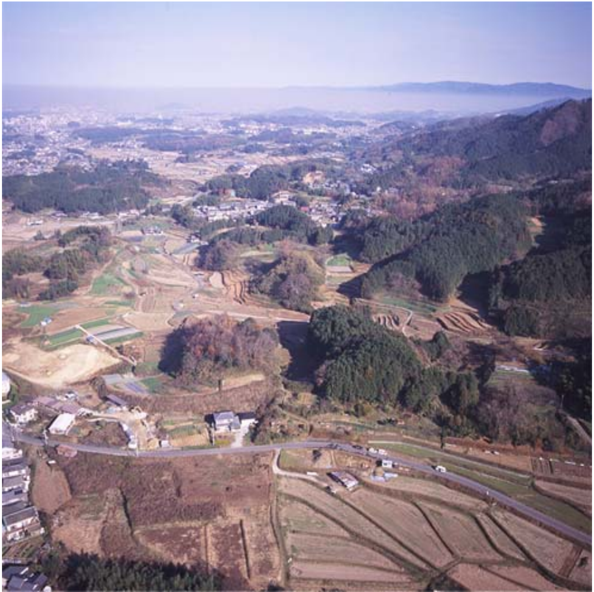
写真1 調査地遠景(南から)