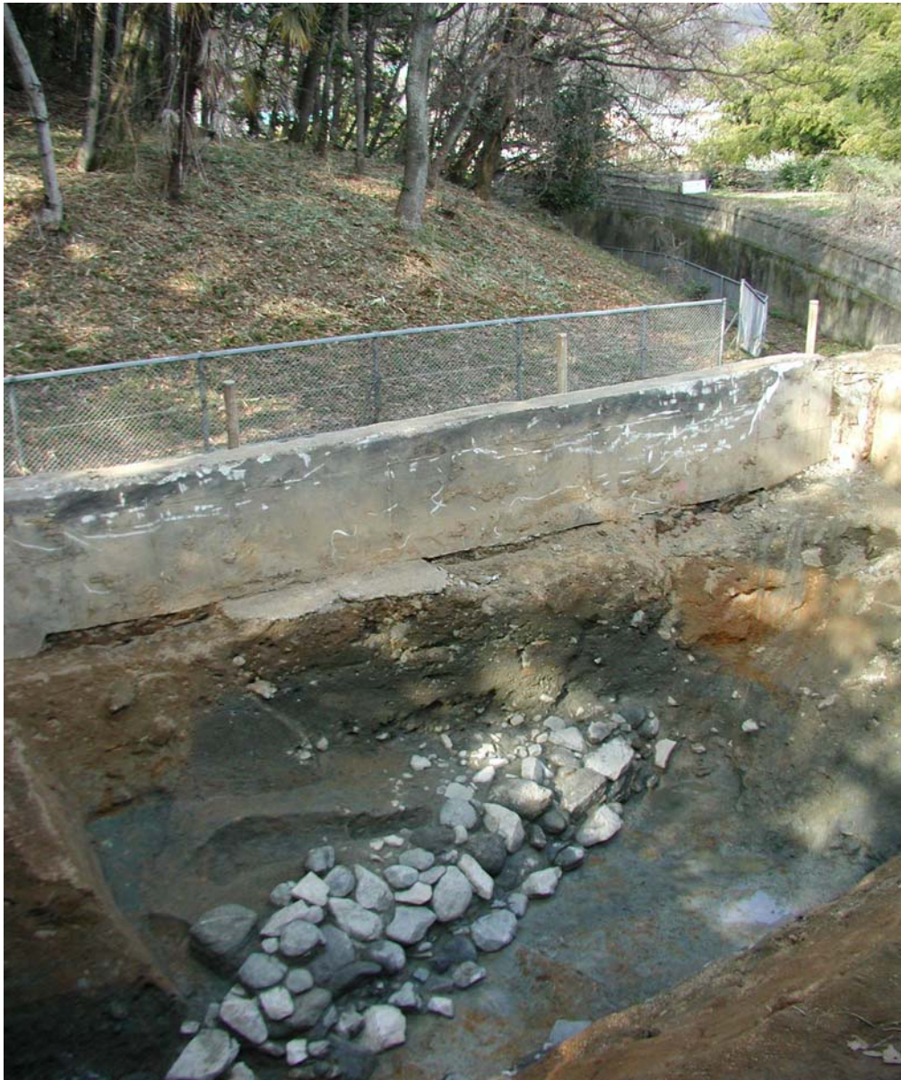
桜井茶臼山古墳の後円部と葺石基底部(南から)