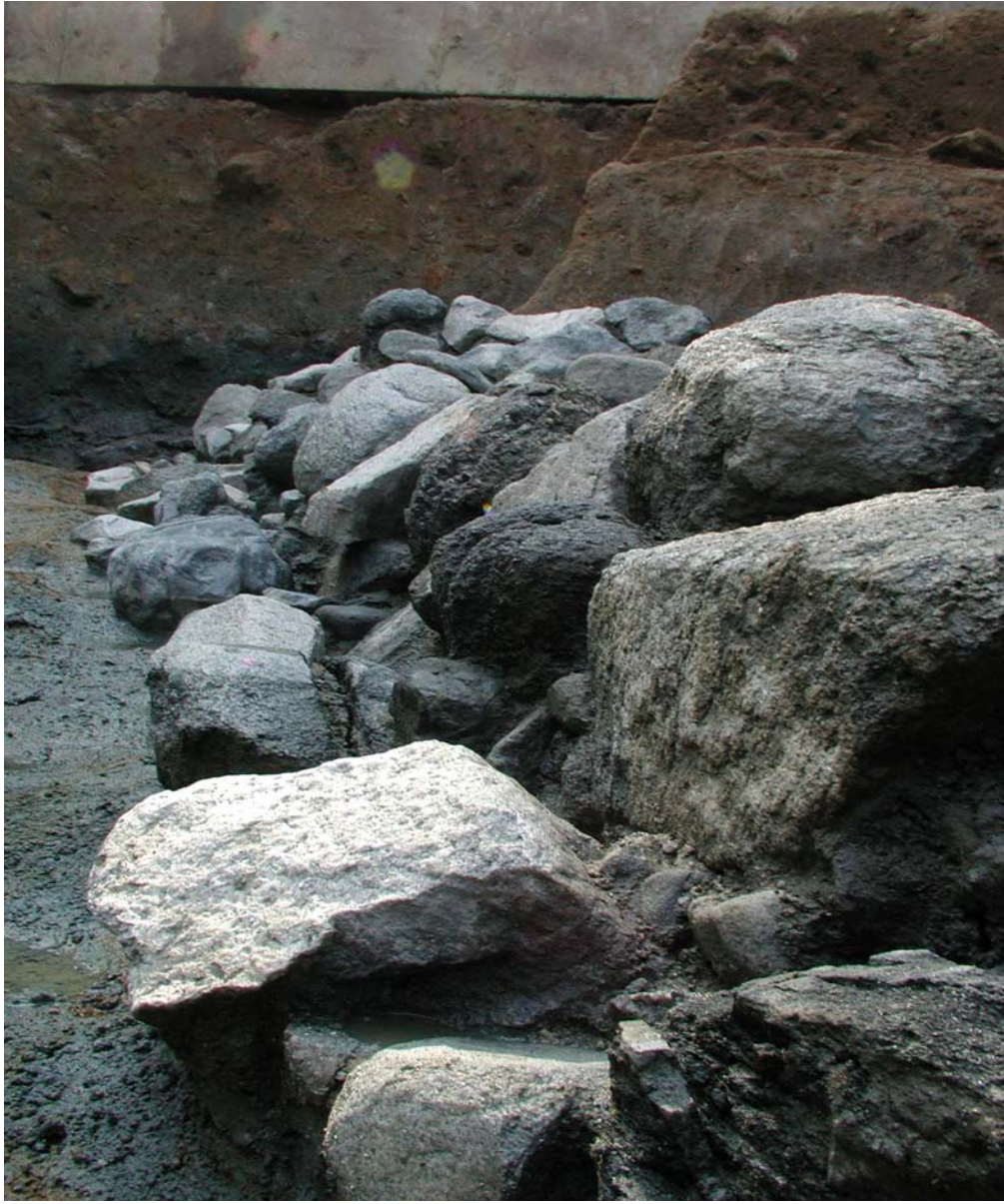
後円部葺石基底部(東から)