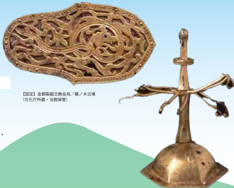
【国宝】金銅製龍文飾金具／藤ノ木古墳 (文化庁所蔵・当館保管)