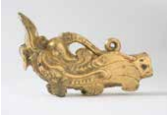
【国宝】金銅製龍頭／沖ノ島5号遺跡 (宗像大社所蔵)

今回の特別展ではこの祭祀に大きく関与した大和の視点から、王権祭祀と古墳の副葬品をキーワードに国家祭祀の実像に迫ります。