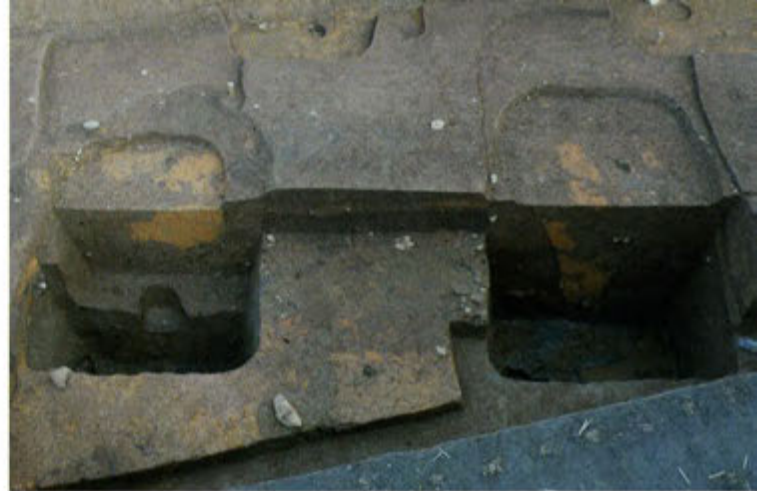
1区 掘立柱塼の柱穴（西から）