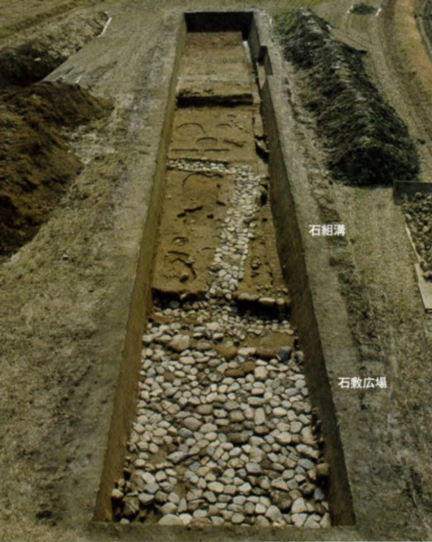
2区全景 石敷広場と石組溝（北から）