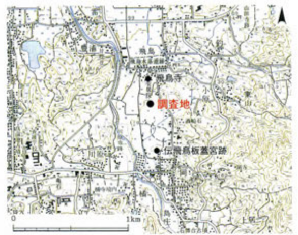
調査地位置図 「国土地理院発行 1/25,000 地形図 (畷傍山) を使用」