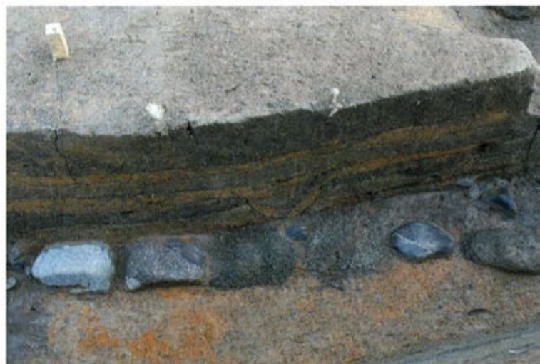
1区 下層の石列と縞状の整地土（西から）