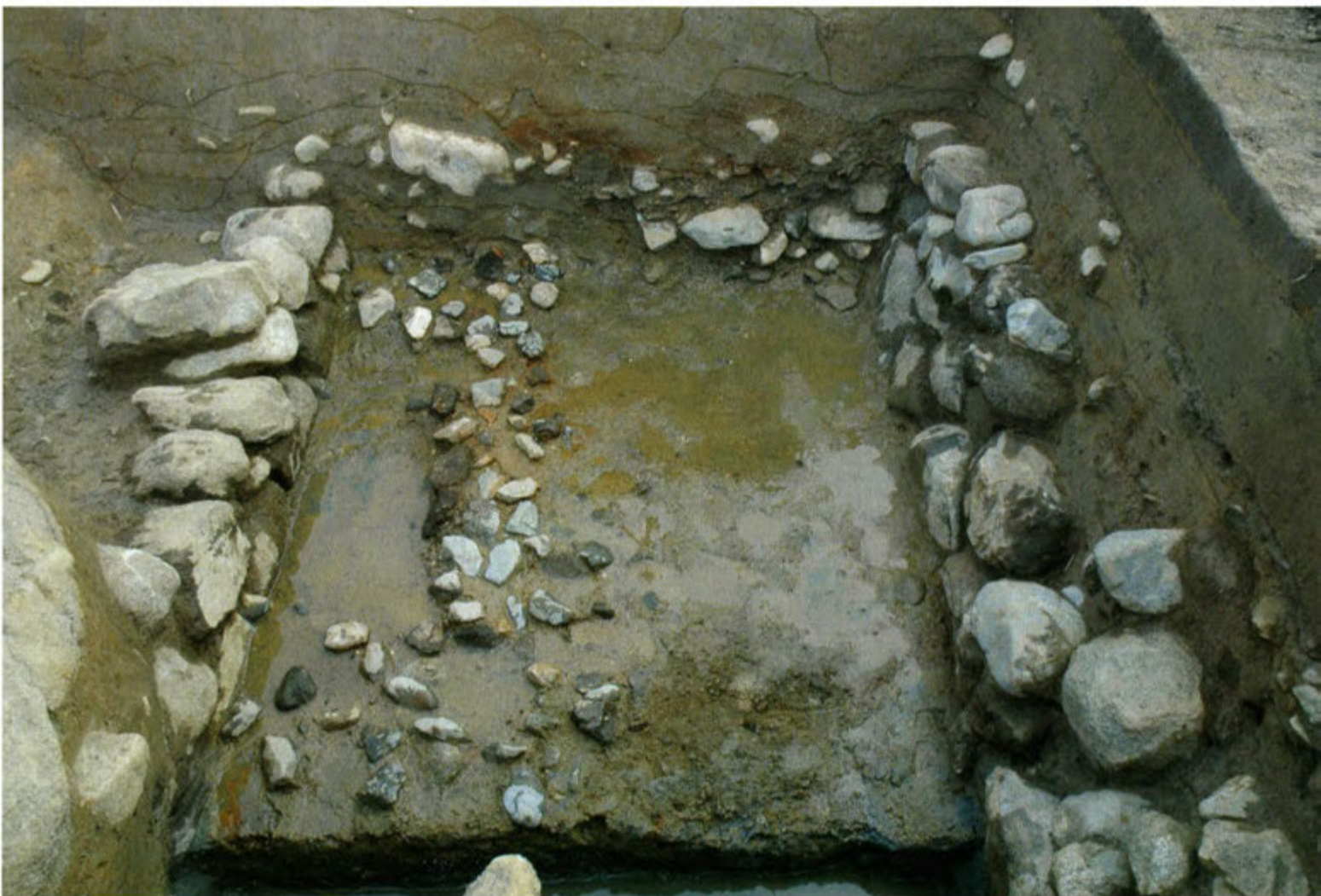
1区 東西方向の石組溝（西から）