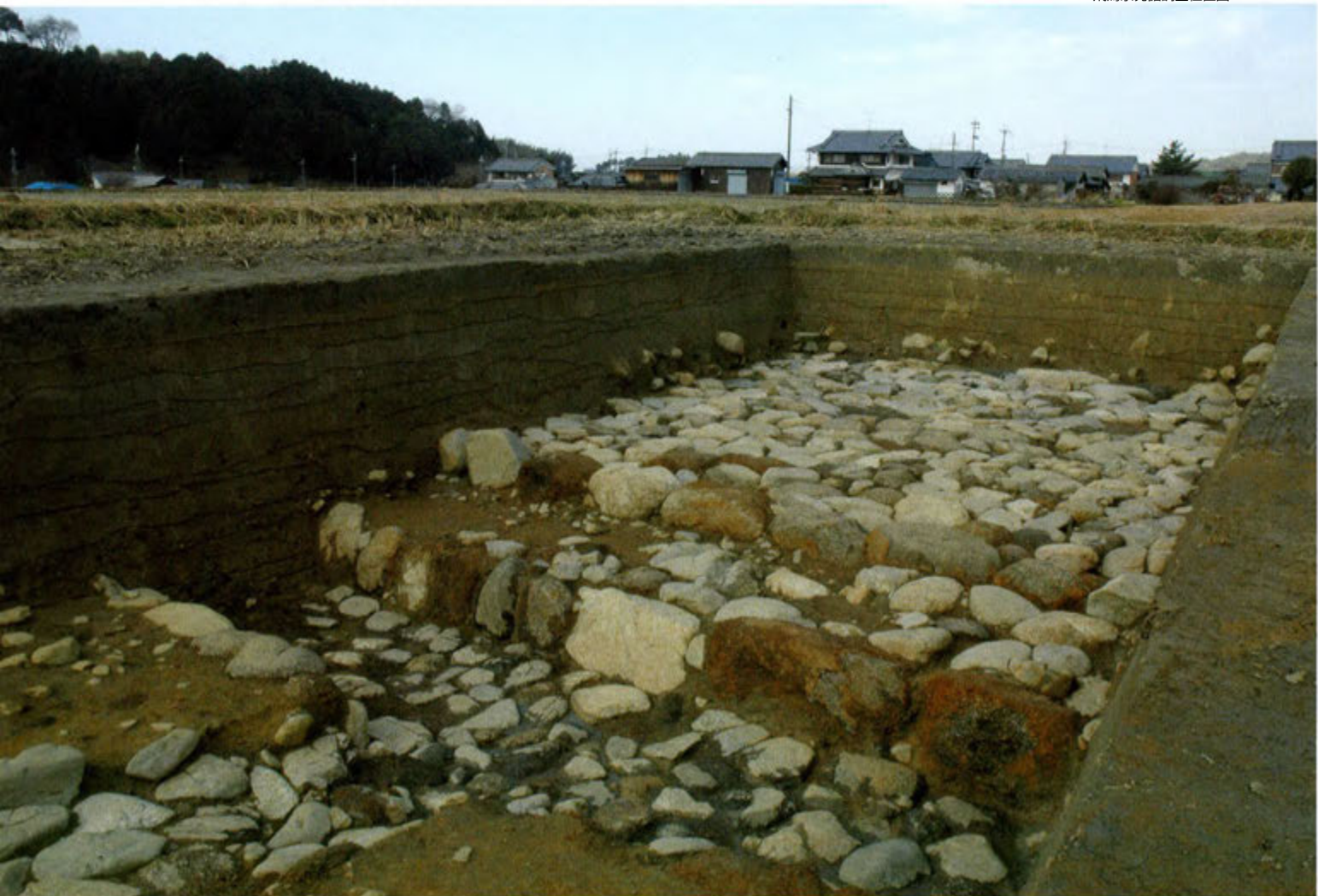
2区 石敷広場から甘樫丘を望む（南東から）