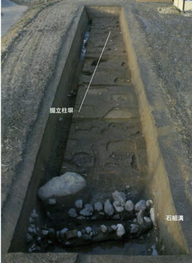
1区全景 石組溝と掘立柱塼（南から）