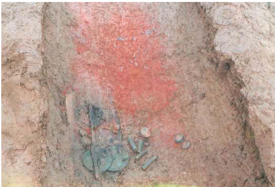
棺内の遺物出土状況