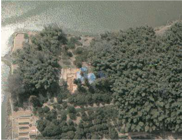
前方部埋葬施設の位置