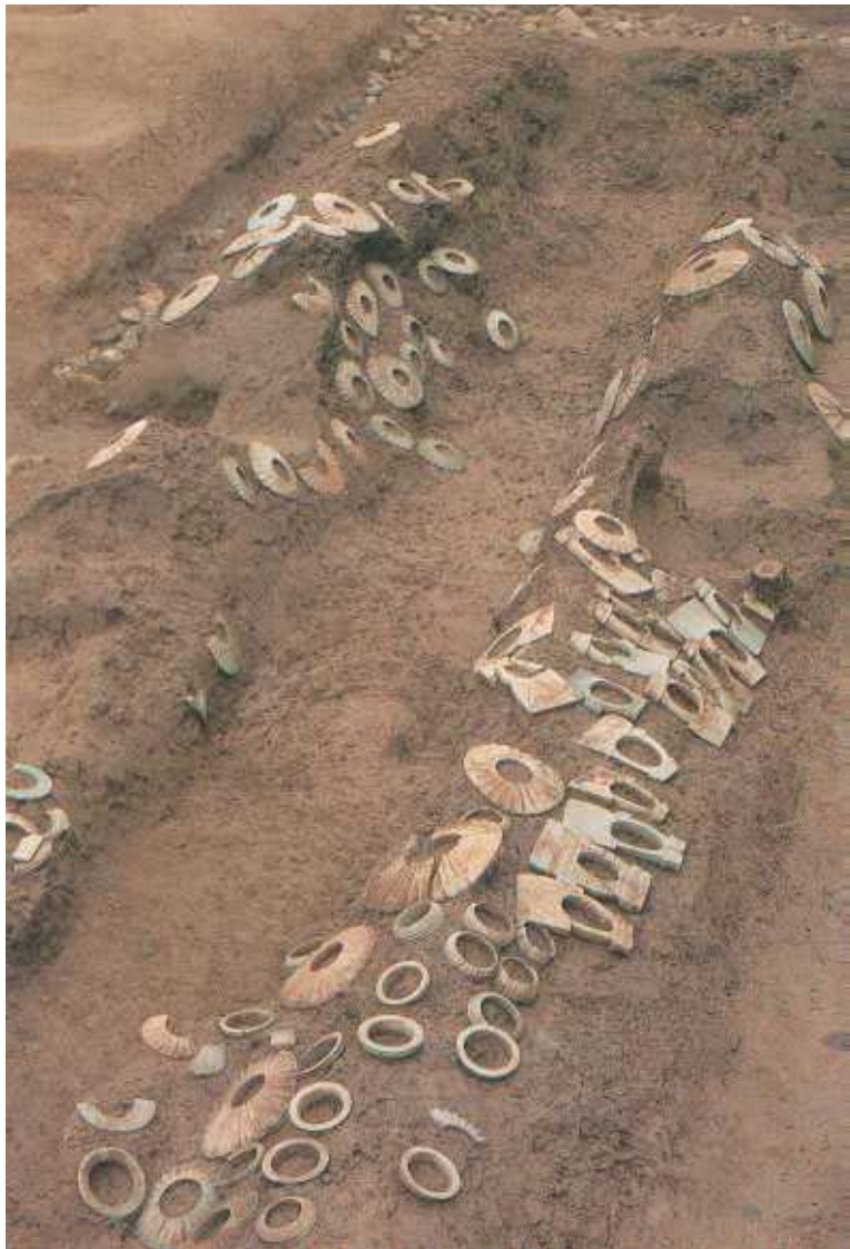
粘土槨南側の石製腕飾類