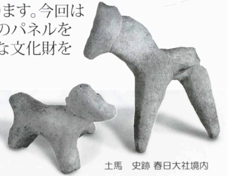
土馬 史跡 春日大社境内

『大和を掘る』は毎年夏に開催する発掘調査速報展で今年で第34回目となります。今回は2015年度に発掘調査された遺跡について、出土遺物および調査写真・図面のパネルを展示いたします。最新の発掘調査の成果を多くの方々にご覧いただき、豊富な文化財を確認し、奈良県の魅力を知っていただきたいと思います。