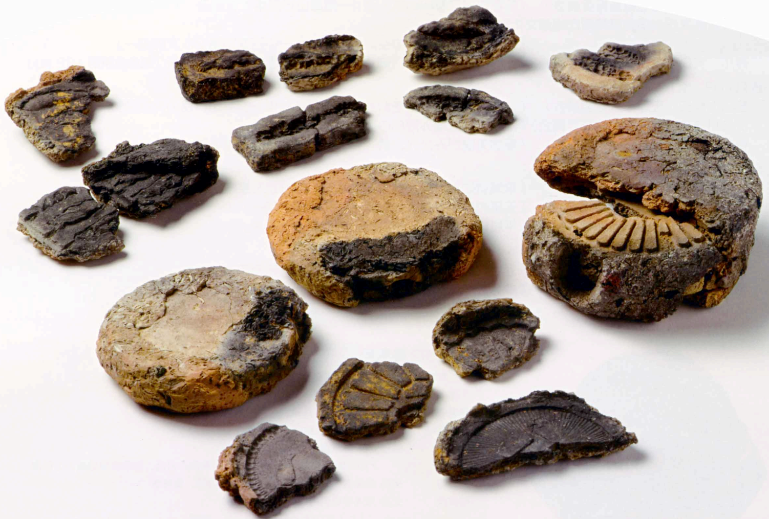
刀装具の鑄型/奈良町遺跡