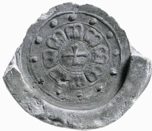
東大寺東塔院跡出土瓦