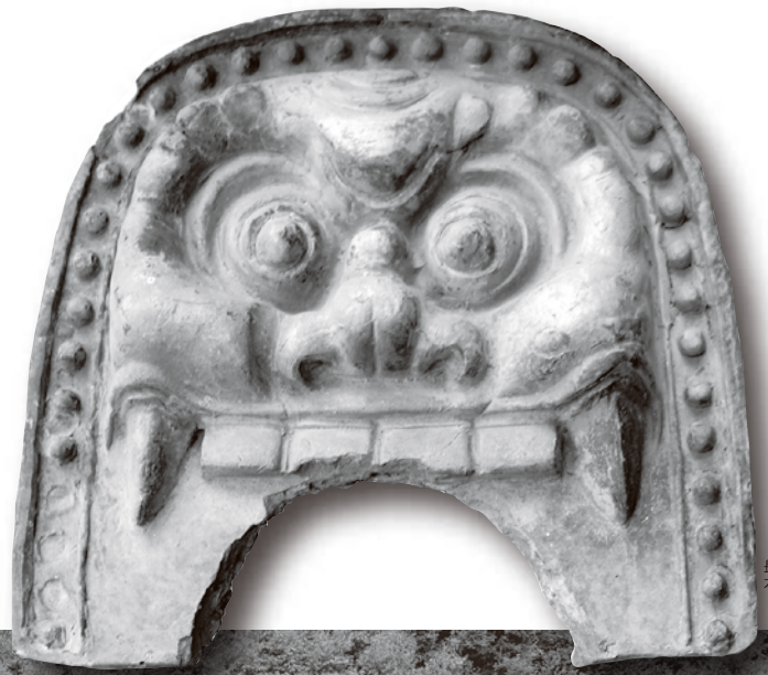
長福寺 本堂 鬼瓦

生駒市俵口町に所在する長福寺は真言律宗の寺院で、鎌倉時代に建立された本堂は重要文化財に指定されています。文化財保存事務所では平成24年度から本堂の保存修理事業を実施しており、それとともに檀原考古学研究所が発掘調査をおこないました。本展覧会では、保存修理とともに実施された建築史、美術史、考古学の多分野による調査成果をご紹介します、長福寺本堂の魅力にせまります。