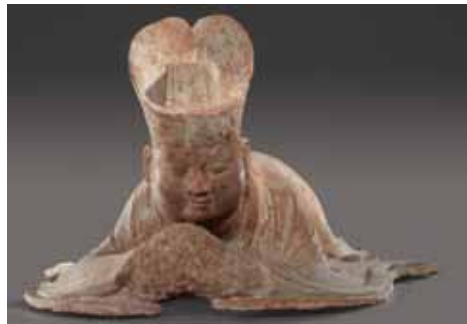
ひざまずく文官の俑(惠陵)

《研究講座》 5月16日(日)・5月30日(日) 6月13日(日) 各日とも午後1時から 《展示解説》 5月16日(日)・5月30日(日) 6月13日(日) 各日とも午前10時30分から ※期間中、無休です。