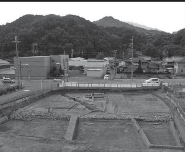
脇本遺跡 第18次調査 池状遺構(北から)