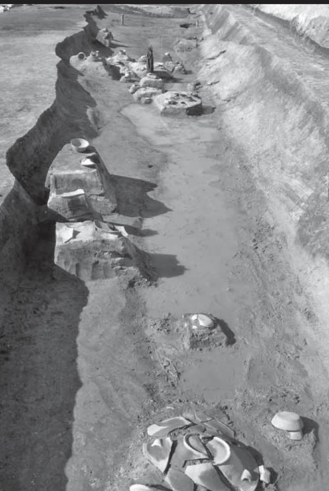
平城京左京五条五坊二坪 溝から出土した土器と橋脚(南から)

夏に恒例の発掘調査速報展「大和を掘る」も31回目となりました。奈良県立橿原考古学研究所附属博物館では、県内市町村教育委員会などのご協力を得て、奈良県内で発掘調査された資料をいち早く展示公開し、多くの方がたにその成果を知っていただく機会を設けるように努めてまいりました。今回は、おもに2012年度に発掘調査された遺跡から、37遺跡の成果を展示します。