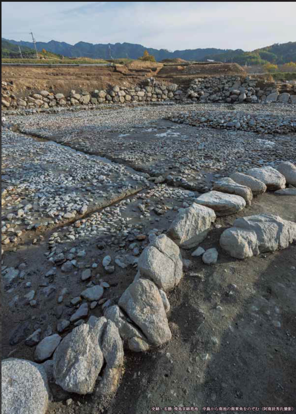
史跡・名勝 飛鳥京跡苑池 中島から南池の南東角をのぞむ