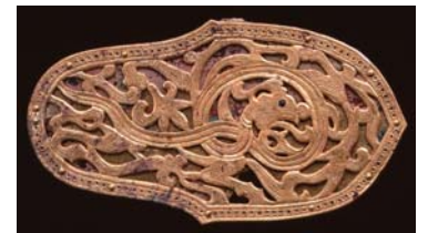
藤ノ木古墳 龍文飾金具(国宝)

橿原遺跡の出土品をはじめ、メスリ山古墳の日本最大の埴輪や、国宝の藤ノ木古墳出土品、飛鳥京跡の出土品など日本考古学を代表する資料をとおして「目でみる日本の歴史」をご覧ください。