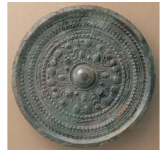
黒塚古墳 三角縁神獣鏡(重要文化財)

橿原考古学研究所は、1938年の創立以来70年以上にわたり発掘調査と研究をおこなってきました。その間には、歴史を塗り替えるような発見も少なくありません。本展覧会では、これまでに出土した逸品から最新の調査成果まで、代表的な出土資料を一室に紹介します。