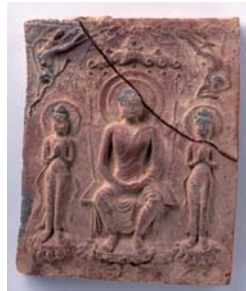
左 川原寺裏山遺跡 方形三尊埴仏 右 飛鳥寺 軒丸瓦

古墳時代後期に伝来した仏教が、当時の社会に与えた意義や影響について展示します。人々の関心は仏教によって墓造りから寺造りへと移ってゆきました。本展覧会では、仏教の影響を「仏教伝来と古墳の変容」、「舍利信仰」、「伽藍造営と堂内荘厳」などの視点で迫ります。