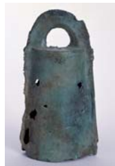
上 新沢一遺跡 水差形土器(重要文化財) 下 廿日山銅鐸(県指定文化財)

《研究講座》 4月24日(日)、5月15日(日)、 6月5日(日) 各日とも午後1時から 《展示解説》 研究講座開催日の各日とも 午前10時30分から 《遺跡見学会》国際博物館の日 5月8日(日)